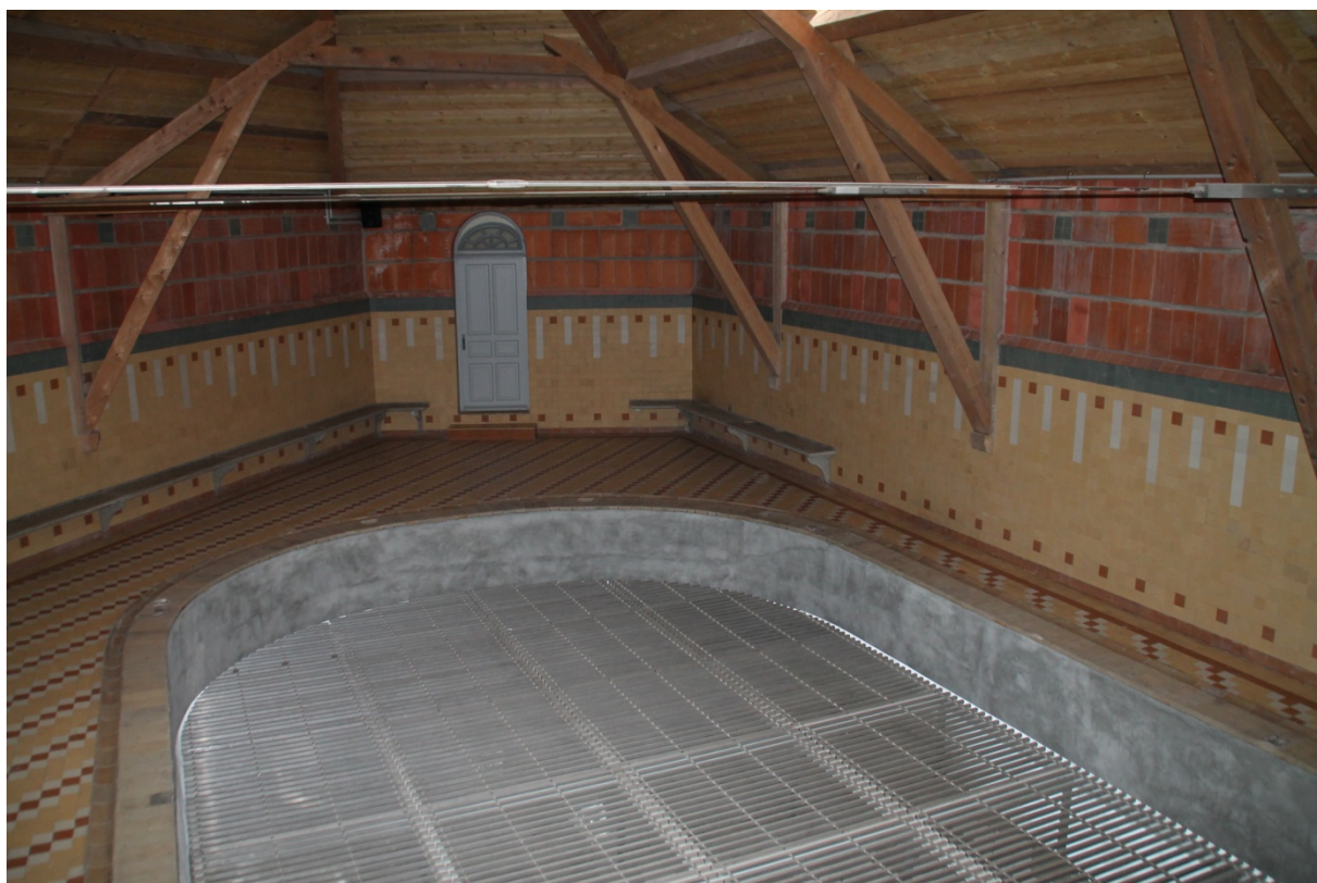
Piscine du familistère

Les habitants bénéficiaient également d'une piscine chauffée et couverte.