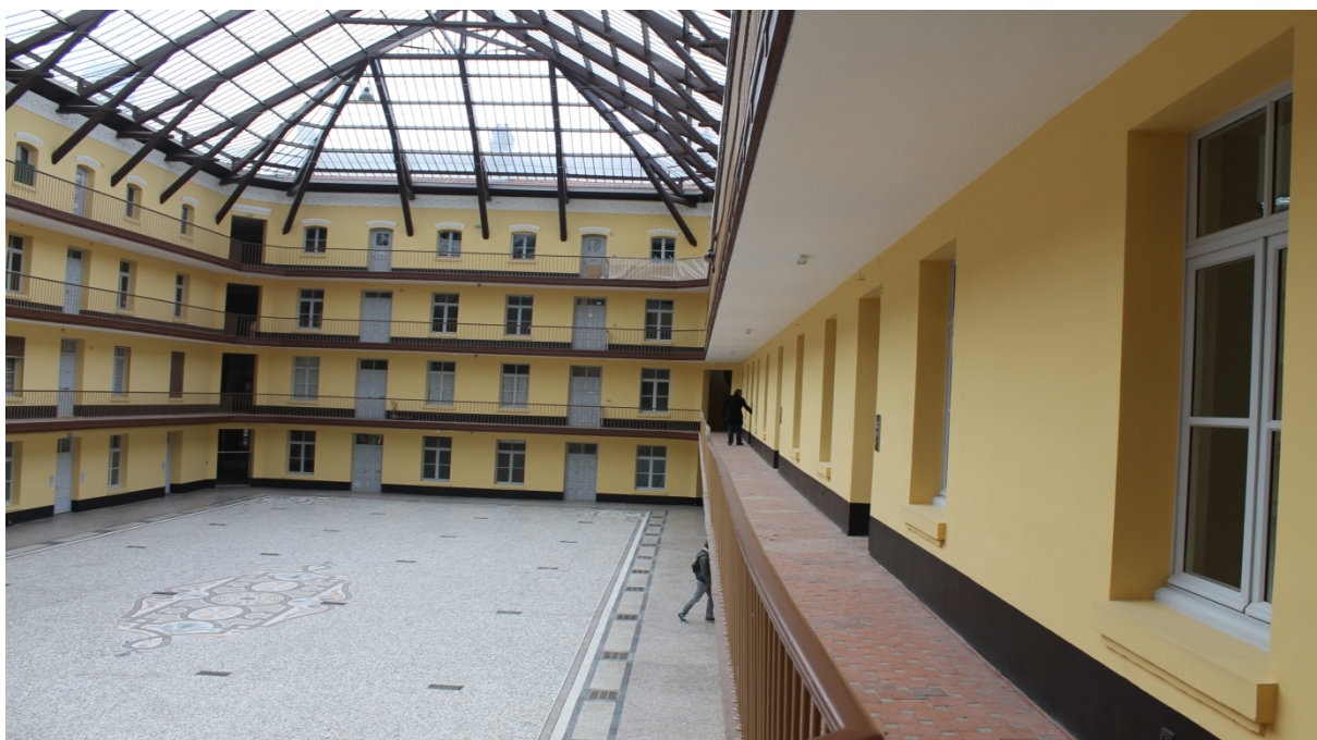
Cour du familistère.

Il existait également un économat (magasin avec des prix préférentiels pour les ouvriers du familistère).